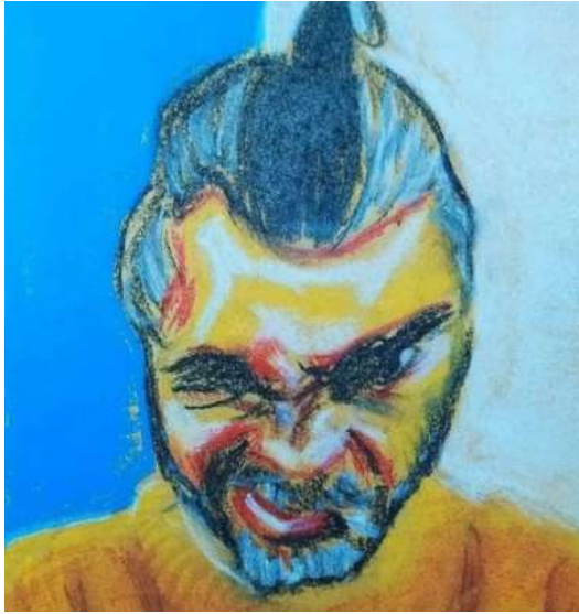
Autorretrato (2021), David Roa.